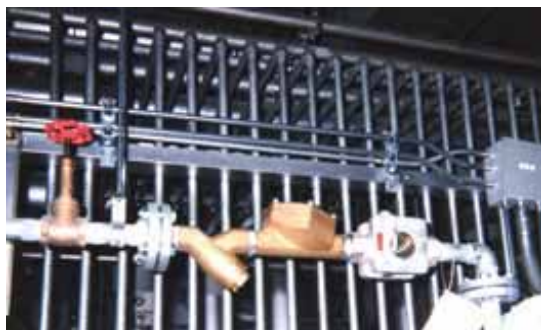
ポラー型式 PI-32CF を冷凍機 70RT 用として設置

大阪市内の大手会社の新築ホテル(31 階建)が平成 14 年春に完成しました。 このホテルはユニバーサルスタジオへ行く駅前に建てられた超近代的ホテルです。 ポラーはこのホテルの空調用冷却水の水処理として大型の吸収式冷温水発生機 500RT 及び冷蔵庫用冷却水系 3 台に設置され順調に稼動しております。冷却水の水質管理基準は薬品注入設備と同一の自動ブロー管理を無薬注で行っています。