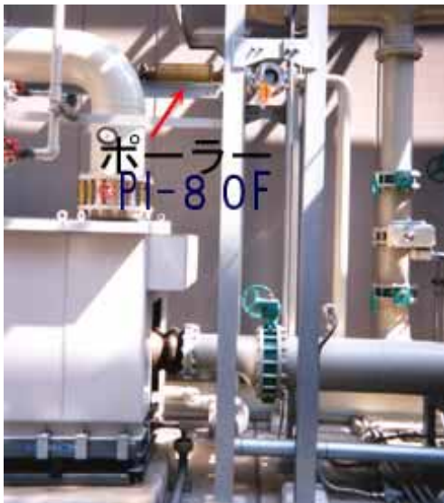
ポラーを空調用 500RT 冷却水ラインに設置

大阪市内の大手会社の新築ホテル(31 階建)が平成 14 年春に完成しました。 このホテルはユニバーサルスタジオへ行く駅前に建てられた超近代的ホテルです。 ポラーはこのホテルの空調用冷却水の水処理として大型の吸収式冷温水発生機 500RT 及び冷蔵庫用冷却水系 3 台に設置され順調に稼動しております。冷却水の水質管理基準は薬品注入設備と同一の自動ブロー管理を無薬注で行っています。