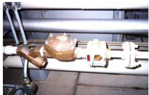
ポラー型式 PI-25CF を冷凍機 35RT 用として設置