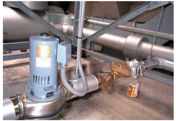
循環ポンプ付 PI-32CF 型