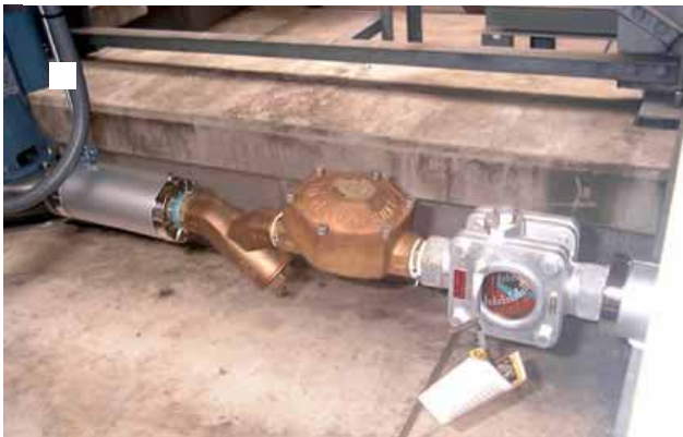
ポローラー型式 PI - 32CF 一式設置写真

現在赤水は出ていないが将来の赤水対策として薬注していたが、それを中止して他の系列ビルで効果が確認されたポローラーを赤水前対策の目的で設置した。