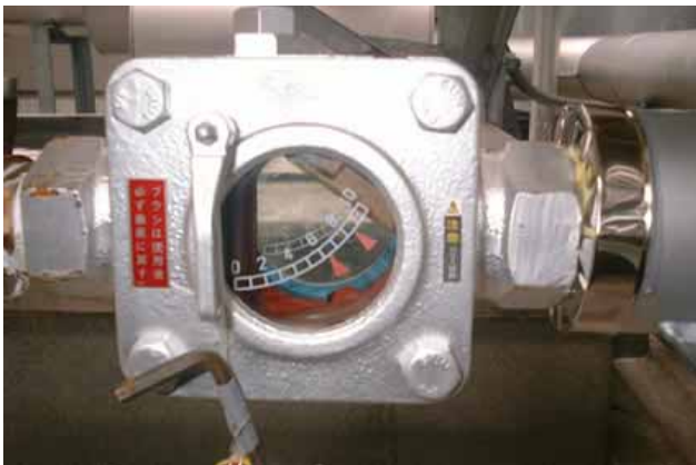
処理流速 3m/秒にて運転 合格