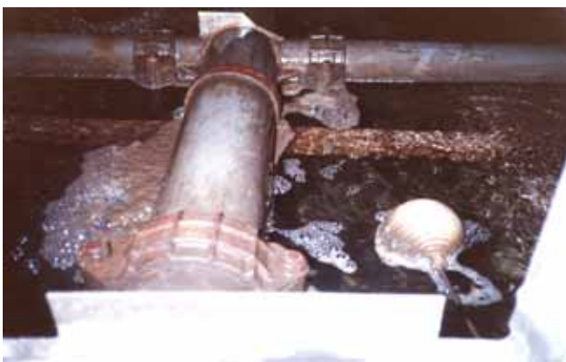
写真 8 : ポーラー処理側の冷却塔内下部水槽

水が濁っている為、底が見えない。 又、水面上に石鹸の様な泡立ちが多く見られた。水は全体的に濁りが多く汚い。