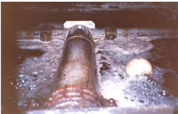
写真 7 : 薬剤処理側の冷却塔内下部水槽

ポーラーを使用した同一個所は写真の様に水藻の発生は全く見られず、以前より水の透明度が上がり水が澄んできている。