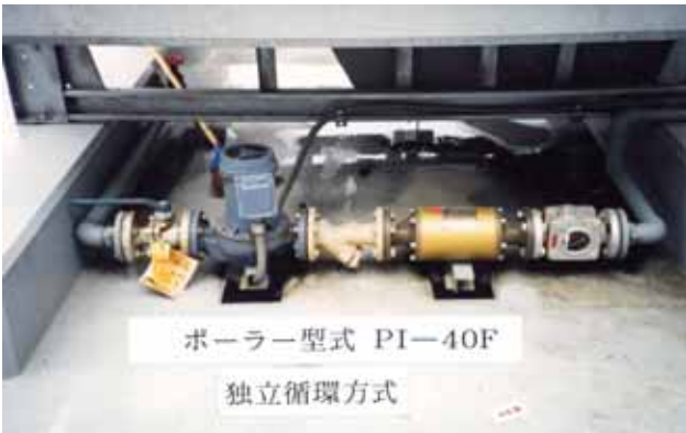
写真 2：ポラーPI 40Fを設置