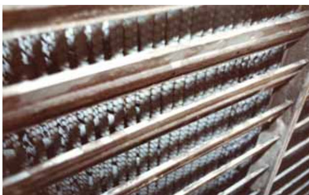
写真 11：ローラー処理側

ローラーを使用した上部水槽には水藻の発生は全く見られず水が透明できわめて綺麗な上部水槽であった。