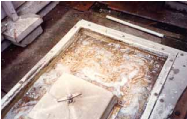
写真 4：ポラー処理側の上部水槽