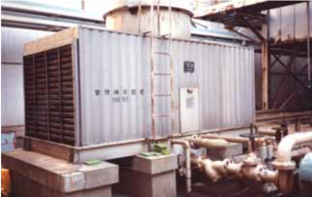
東京都の某公的施設においての比較試験 写真 1：開放式冷却塔 100RT