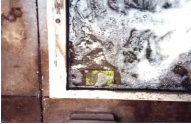
写真 5 : 薬剤処理側の上部水槽