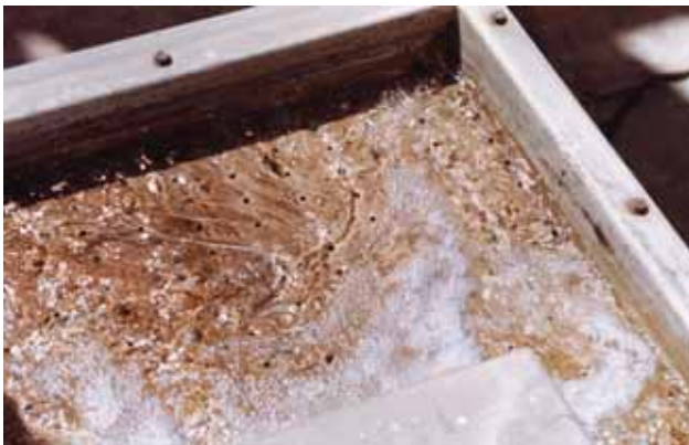
写真 6 : ポーラー処理側の上部水槽

防止剤を使用した方は写真の様に全体に水藻の発生が多く見られ、水に泡立ちが多い。水の濃縮が激しいため薬剤の効果が薄いようであった。