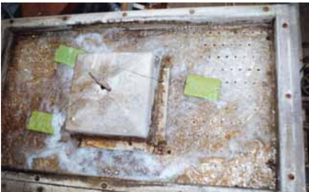
写真 3：薬剤処理側の上部水槽