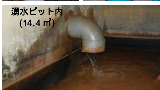
平成 21 年 水質分析表 (湧水の一過水)